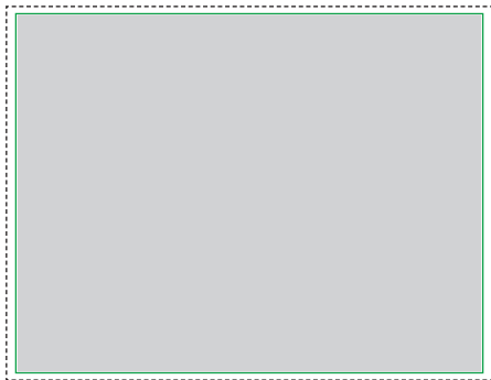
1:1 Vorlage auf Seite 2